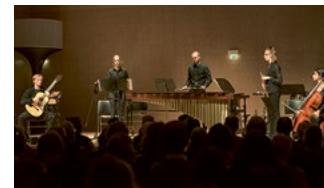
Ein Ensemble der Musikhochschule Stella Vorarlberg zur Ausstellung »Right Now« mit Arbeiten von Studierenden der Universität Paris 8 (2023).